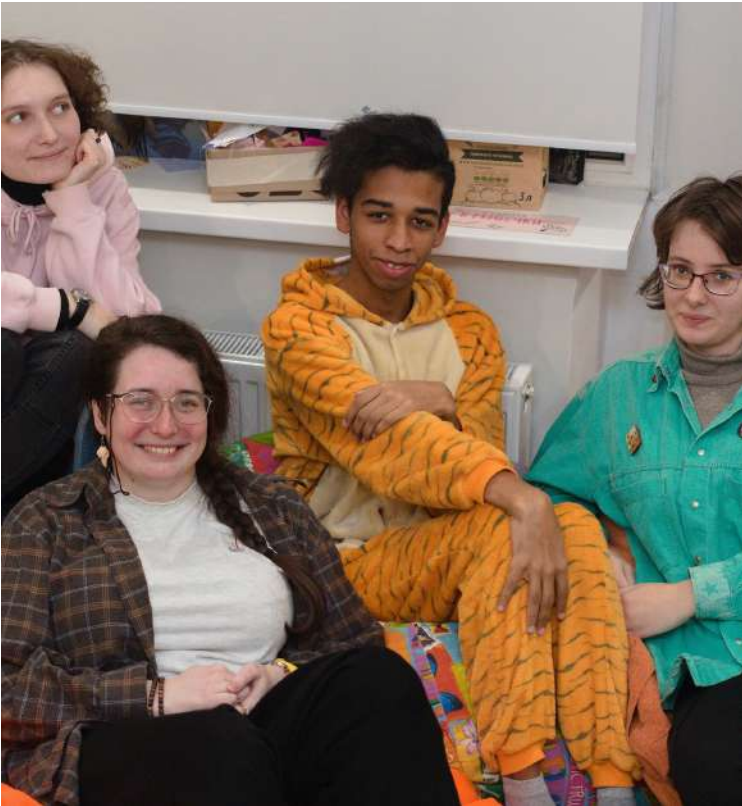
Команда подросткового клуба на Селигерской