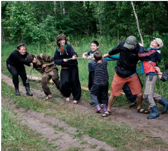
Летняя выездная программа

Подростки 10-17 лет и их родители, специалисты помогающих профессий, работающие с подростками