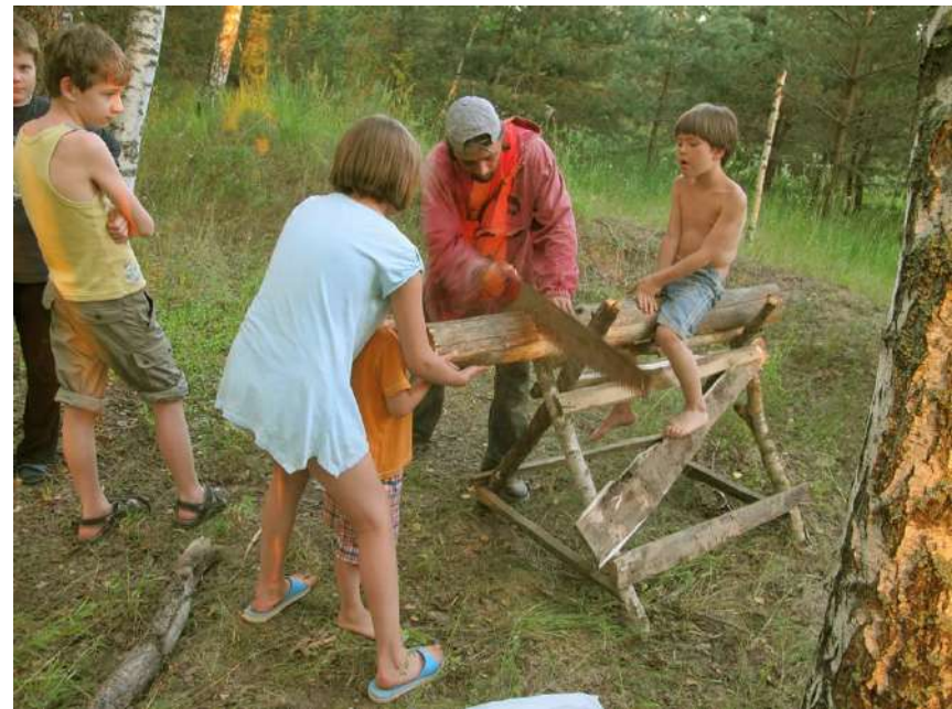
Летняя выездная программа